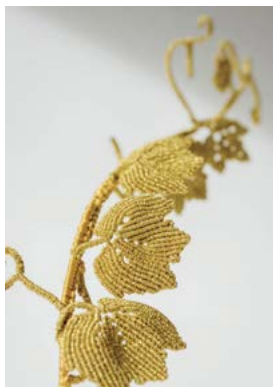
© Laurentine Périllou - textile broder