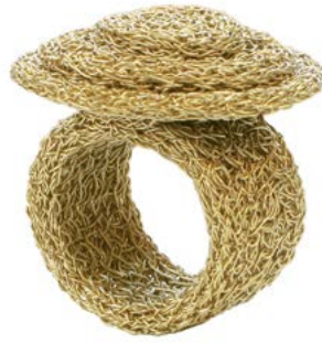
© Yannick Mur - bijoux d'artiste