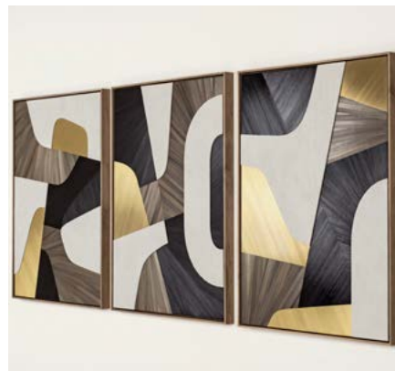
© Marika Michelon - marquetterie de paille